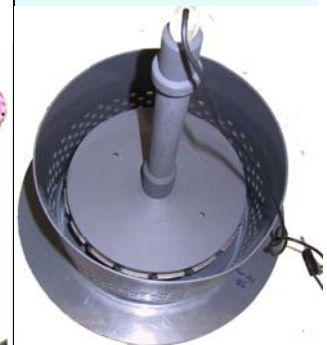
Profilscheiben-Kontakt- und Aufnahmevorrichtung in Abschirmvorrichtung eingesetzt