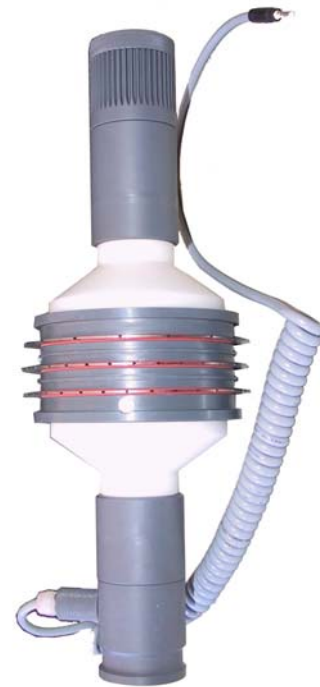
Trennscheiben-Kontakt und Aufnahmevorrichtung