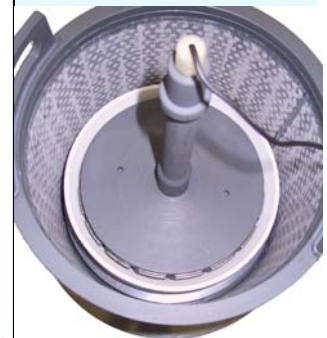
Profilscheiben-Kontakt- und Aufnahmevorrichtung in Diamantierkorb eingesetzt