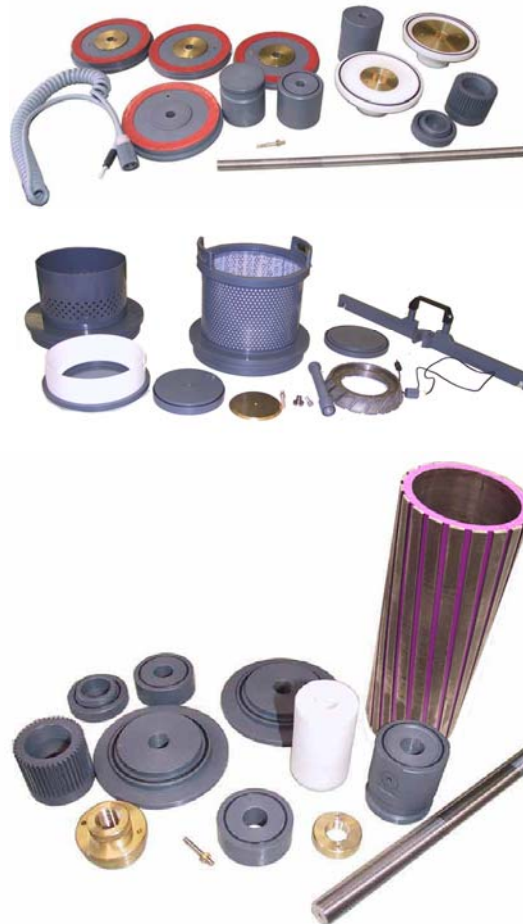
Kontakt- und Aufnahmevorrichtungen für Trennscheiben (rechts oben), für Profilschleifscheiben (rechts mitte) und für Schleifwalzen (rechts unten)