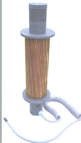
Schleifwalzen-Kontakt und Aufnahmevorrichtung