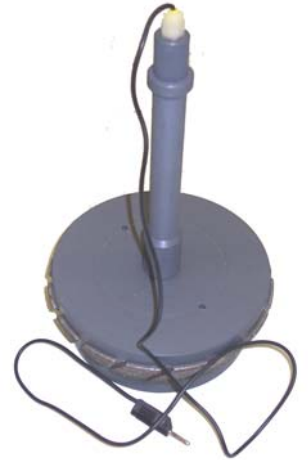
Profilscheiben-Kontakt- und Aufnahmevorrichtung montiert