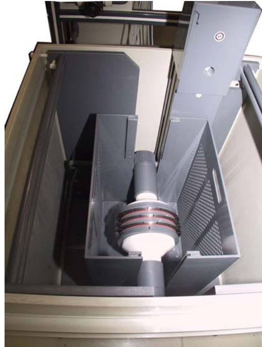
Innenansicht der 2. Beschichtungsstation mit Beschichtungskassette und Trennscheiben-Vorrichtung