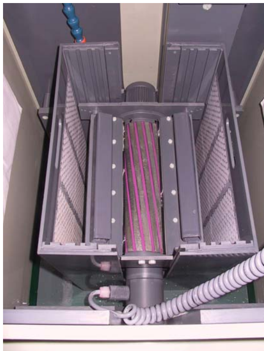
Innenansicht der 3. Beschichtungsstation mit Beschichtungskassette, Schleifwalzen-Vorrichtung und Diamantrückhaltebürsten (links)