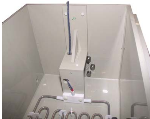
Vorbereitung zur Erweiterung der Anlage auf insgesamt 8 Beschichtungsstationen