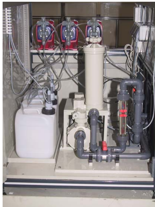
Innenansicht der PRSE mit Vorratsbehältern für Elektrolytkonstanthaltung und pH-Regulierung, Dosierpumpen, Umwälzpumpe M50, Kerzenfiltereinheit 1 x 10", Durchflussmesser und Durchflussmengenventil