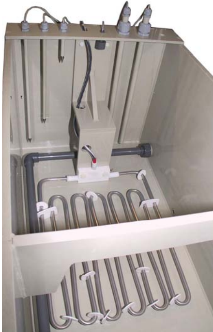
Innenansicht des Beschichtungsbehälters mit Heizungen sowie Niveau- und Temperatursensoren